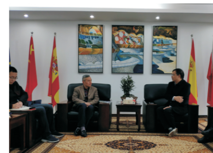
帮助解决的就要帮助解决，以减轻企业的后顾之忧。

顾正为先生是朱董的老朋友，这次来访的目的也是到企业走访，为企业提供服务。宁波欧洲工业园作为其服务对象之一，顾副部长表示有困难要提出来，政府能